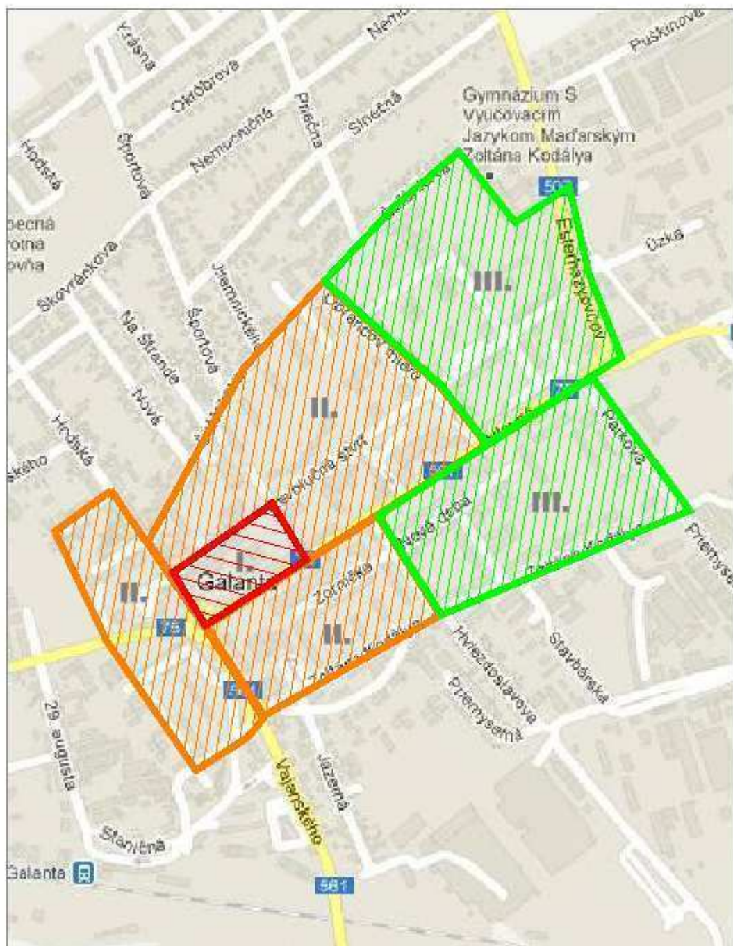
Príloha č.1 Prehľad jednotlivých zón v centre mesta Galanta

DIC Bratislava, s.r.o. Kancelária 16 821 08 Bratislava