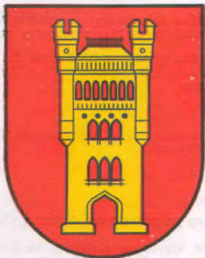
ERB MESTA GALANTA