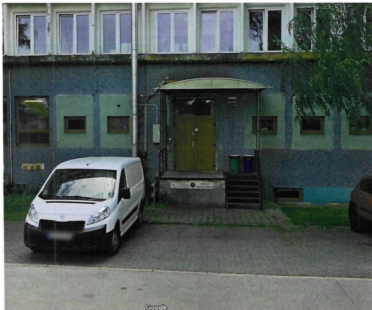
Nákladná rampa – Gazdovský dvor