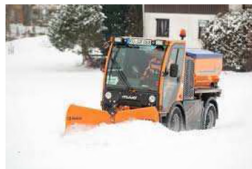
Multifunkčné vozidlo v š. 1310 mm

3. TsMG predložia kalkuláciu mzdových nákladov pre vodiča multifunkčného vozidla za obdobie 15.11- 31.12.2019, pracovníka pre obsluhu zametacieho stroja za obdobie 15.11- 31.12.2019 a ďalej náklady na PHM a posypový materiál za uvedené obdobie .