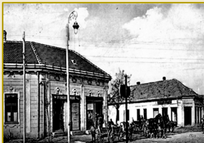
Text: z knihy Juraja Pekaroviča „Galanta na starých pohľadniciach“ Zostavil: Juraj Stern

domu. Na obrázku križovatky výrazne vyniká dlažba, realizovaná v roku 1902. Na obrázku z roku 1914 vidno inú časť križovatky piatich ulíc na hornom konci mesta. Vľavo je rožný dom medzi ulicou Lajosa Kosutha, ktorá viedla na železničnú stanicu, a Dioseckou ulicou (dnes Bratislavská ulica). Druhý dom bol takisto rožný a stál medzi Dioseckou ulicou a Hodskou ulicou. V tomto dome sa nachádzali byty a v časti smerom do križovatky Weiszov obchod s bielizňou. Zaujímavosťou záberu sú aj sedliacke vozy, ktoré boli v tom čase prevážajúcim dopravným prostriedkom. Pozoruhodný je aj stĺp verejného elektrického osvetlenia, ktoré vybudovali v Galante v roku 1909.