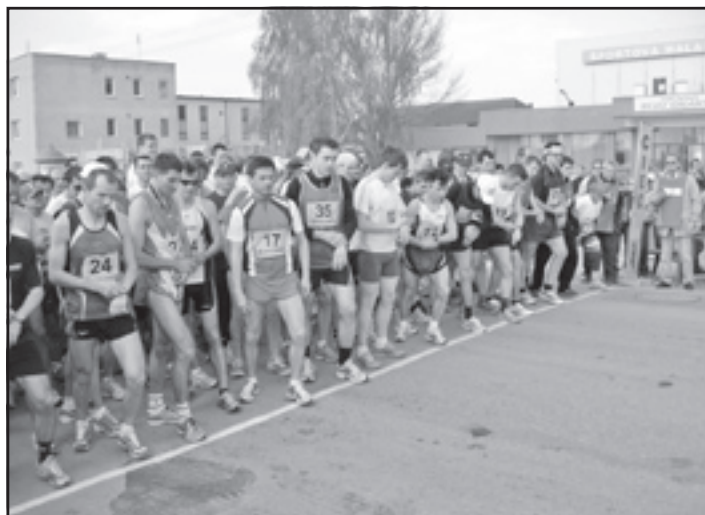
Štart bežcov hlavnej kategórie.