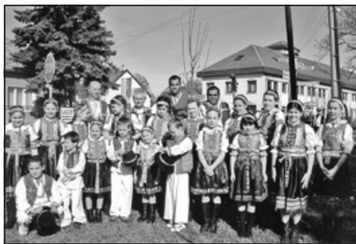
Pri slávnostnom sadení stromčekov pred Domom Matice slovenskej zatancovali deti z folklórneho súboru Važinka zo Šoporne.

VO VLASTIVEDNOM MÚZEU V ZNAMENÍ MEDZINÁRODNÉHO DŇA MÚZEÍ