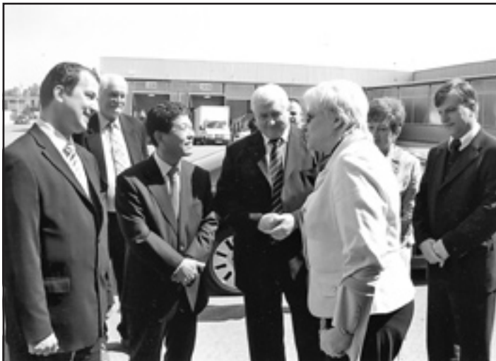
Ministerka Viera Tomanová sa na nádvorí zvitáva s vedením spoločnosti Samsung.