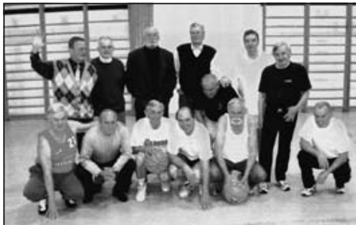
Stari páni basketbalu z Galanty.