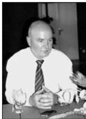
Marián Janušek, minister výstavby a regionálneho rozvoja SR.

šalianskeho regiónu vyslovil svoj názor a prisľúbil podporu.