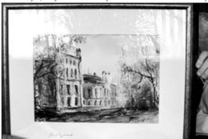
Dar mestu – obraz neogotického kaštieľa.

Keď odovzdával obraz primátorovi mesta, vyslovil prosbu, aby bol umiestnený v Renesančnom kaštieli na takom mieste, aby si ho mohol hocikedy pozrieť. Primátor bol darom pre mesto nadšený a vyslovil radosť nad tým, že aj takéto veci sa dejú v Galante. Podobnú iniciatívu by