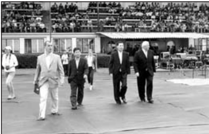
Do Galanty prišiel aj kórejský veľvyslanec Yong kyu Park (druhý sprava).