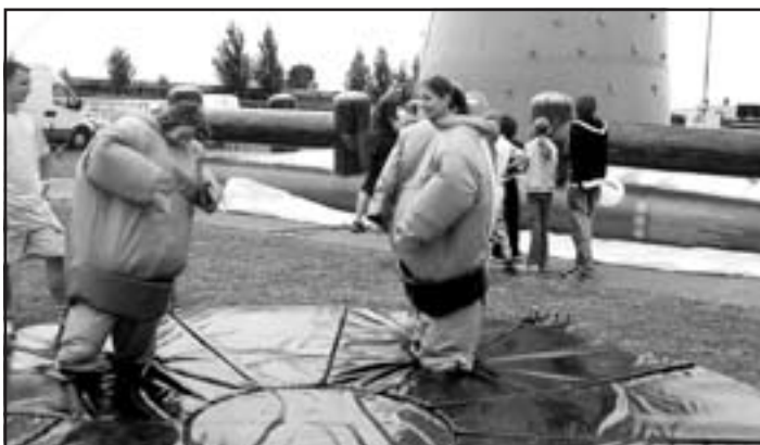
Dievčatá súperili v super sumo.