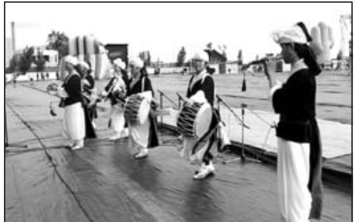
Kórejskí hudobníci Samulnori so svojimi bubnami.