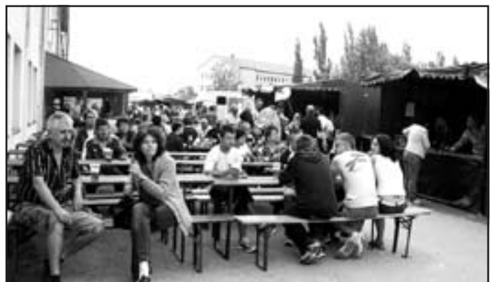
O občerstvenie bolo ako vždy dobre postarané.