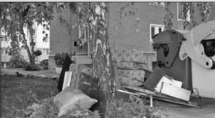
Fotografia je z Poštovej ulice pri bytovke č.915.

Spracovala: Ing. Kissová, MsÚ