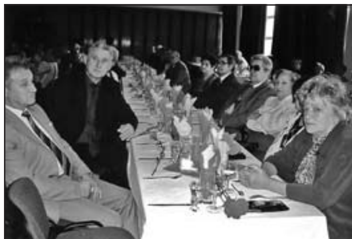
Dôchodcovia – jubilanti na slávnostnom stretnutí pri príležitosti Októbra – mesiaca úcty k starším.