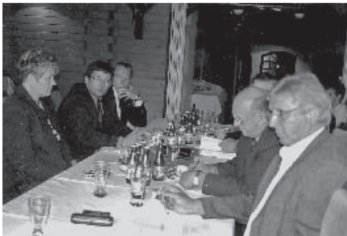
Pracovného zasadnutia Galantsko – šalianskeho regiónu sa zúčastnili starostovia obcí a primátori miest.