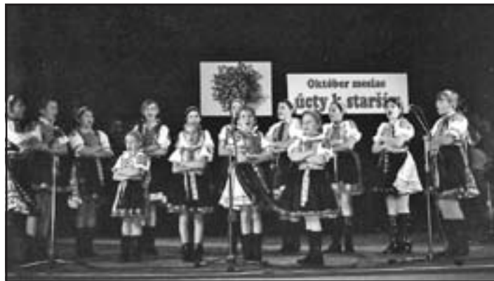
Z vystúpenia súboru Važinka zo Šoporne.

prácou a láskou k rodine, vašim najbližším. Cez omrvinku ste spoznávali vôňu chleba, cez skromnosť ste vo svojich deťoch šľachtily vzťah k práci a k iným hodno-