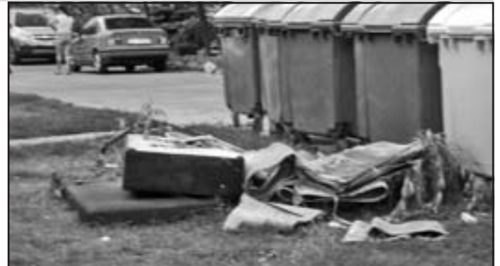
Fotografia zo štvrte SNP – stanoviisko kontajnerov za obchodnou prevádzkou Potraviný a ovocie.

Dňa 14.10.2008 bolo vykonané súčinnosťné cvičenie orgánov krízového riadenia obvodných úradov v Trnavskom kraji, územnej samosprávy a základných záchraných zložiek integrovaného záchraného systému pod názvom HOLUBICA 2008.