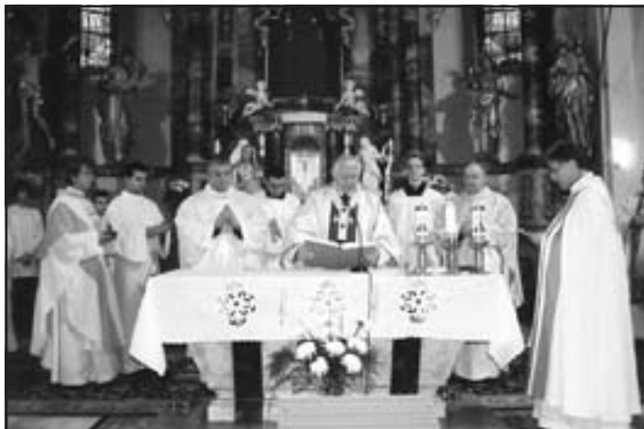
Snímka je z korunovácie sochy Sedembolestnej Panny Márie, po jej rekonštrukcii v galantskom kostole.