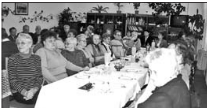
Seniori – účastníci osláv jubilea.