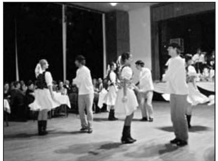
Folklórna skupina Nadženci z Trenčína.