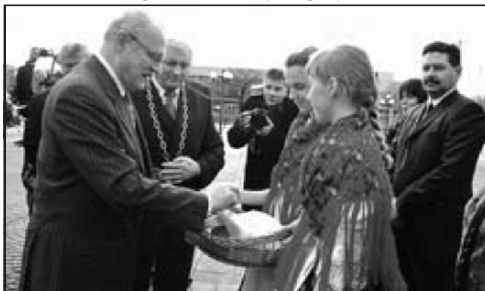
Prezidenta Gašparoviča privítali v Galante chlebom a soľou.