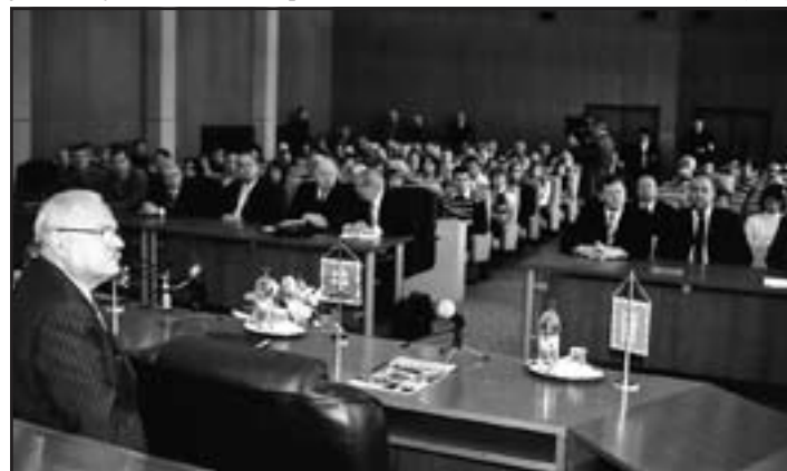
Na stretnutí so samosprávou, podnikateľmi a občanmi mesta.