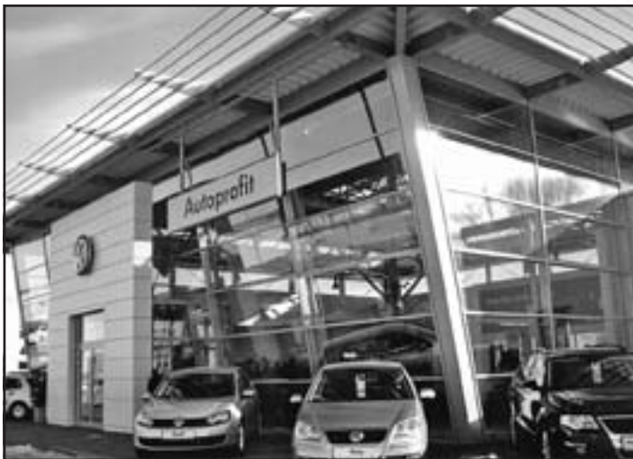
Majestátna stavba nového autosalónu Volkswagen v Galante.