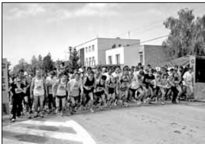
Štart atlétov hlavného behu.