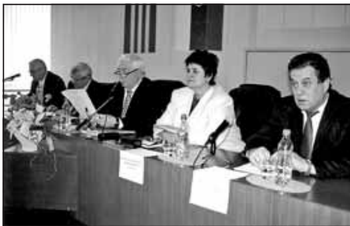
Fotografie z Valného zhromaždenia ZMOS – u Galantsko – Šaliansko.