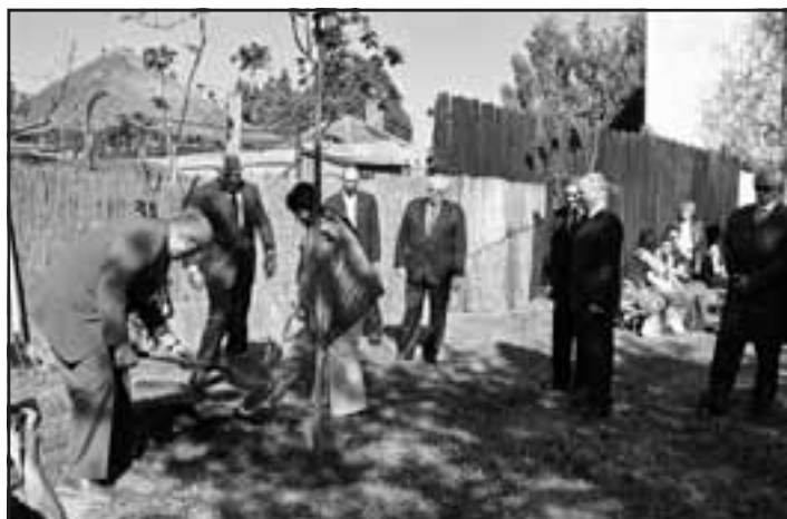
Slávnostný akt sadenia lípy pri Dome Matice slovenskej.

Margita Knappová