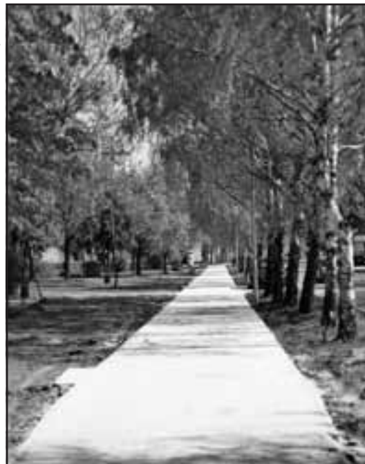
Nový chodník na ulici Zoltána Kodálya.