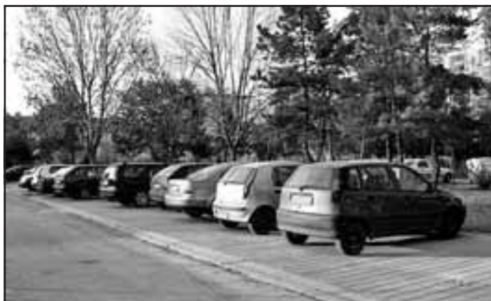
Nové parkovisko na sídlisku Nová Doba.