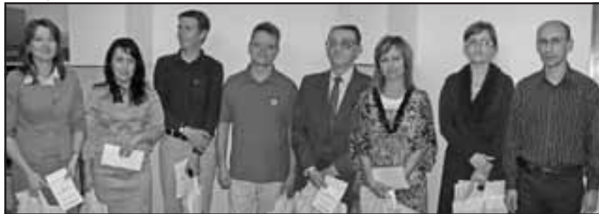
Zodpovedný redaktor PhDr. Milan Aľakša sa poďakoval dopisovateľom za spoluprácu pri tvorbe Galantských novín. Najlepší dopisovatelia boli odmenení.