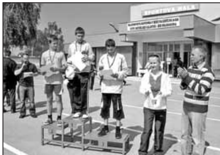
Diplomy víťazom odovzdávali: PaedDr. Henrieta Csemezová a Jozef Vigh.