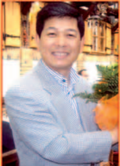
JAE HYUNG LEE sej prezident Samsungu