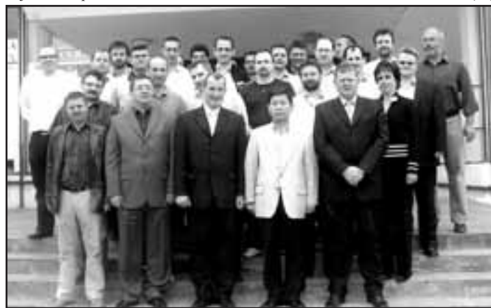
Na rozlúčke s prezidentom sa zúčastnilo vedenie mesta Galanta a vedenie spoločnosti Samsung.