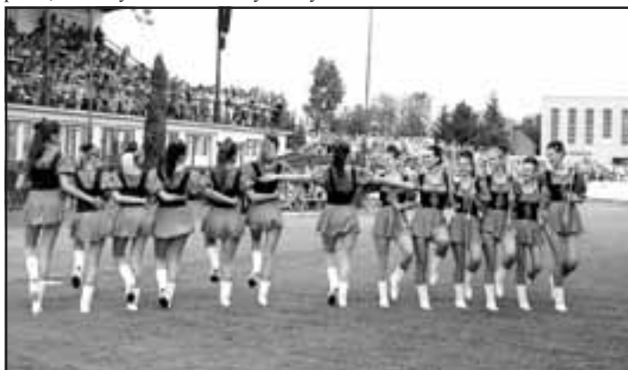
Mažoretky ISIS z Bratislavy pred zaplnenou tribúnou štadiónu.