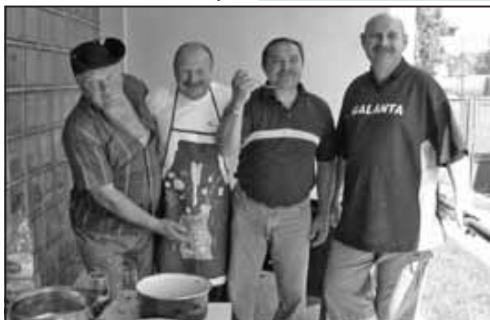
Pri guláši sme zastihli Suchopu, Mrvu, Šemetku a Kaigla.