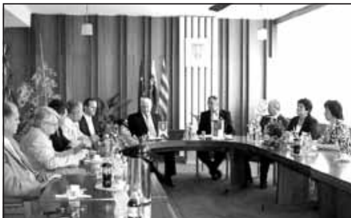
Celkový pohľad na účastníkov podpisu Dohody o obnovení zmluvy medzi Galantou a Tótkomlóšom na roky 2009 – 2019.