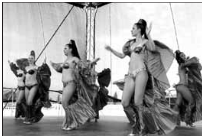
Súbor španielskych tancov Tropicana z Bratislavy.