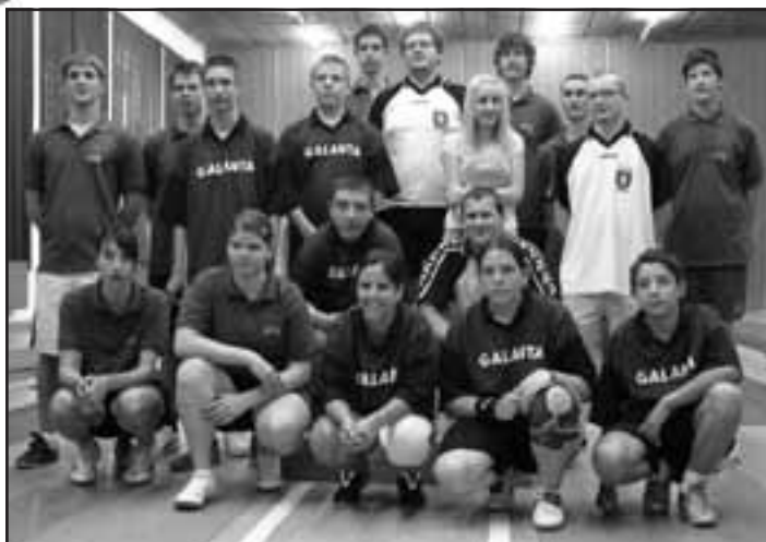
Účastníci medzinárodného stretnutia, mladí kolkári Galanty a Budapešti.