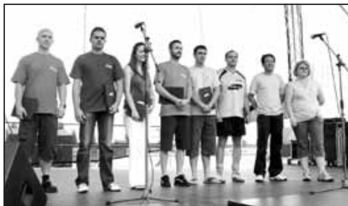
Zamestnanci Samsungu s diplomom Najlepší pracovník.