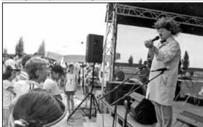
Majstra N už poznajú všetky galantské deti.