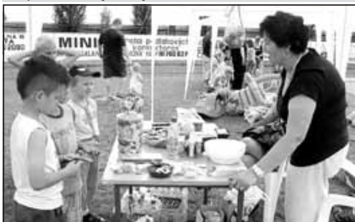
Detské hody, kde si kupóny vymieňali za sladkosti.